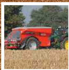
KUHN AXENT 100.1 MET ONAFHANKELIJKE AFSTELLING PER STROOISCHIJF