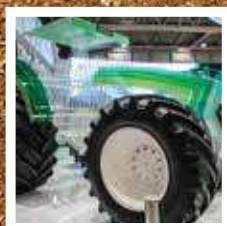
BKT : EEN BREDE WAAIER AAN LANDBOUWBANDEN