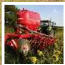
HORSCH AVATAR SD